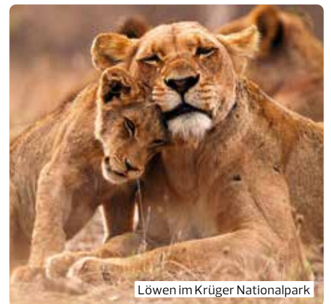
Löwen im Krüger Nationalpark