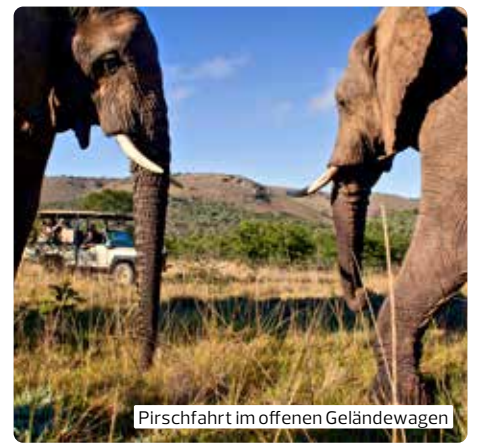
Pirschfahrt im offenen Geländewagen