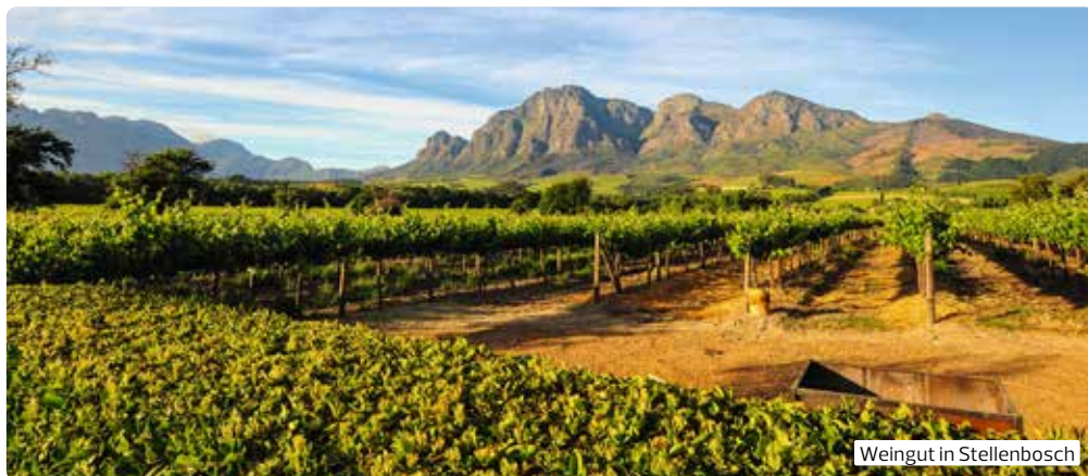
Weingut in Stellenbosch